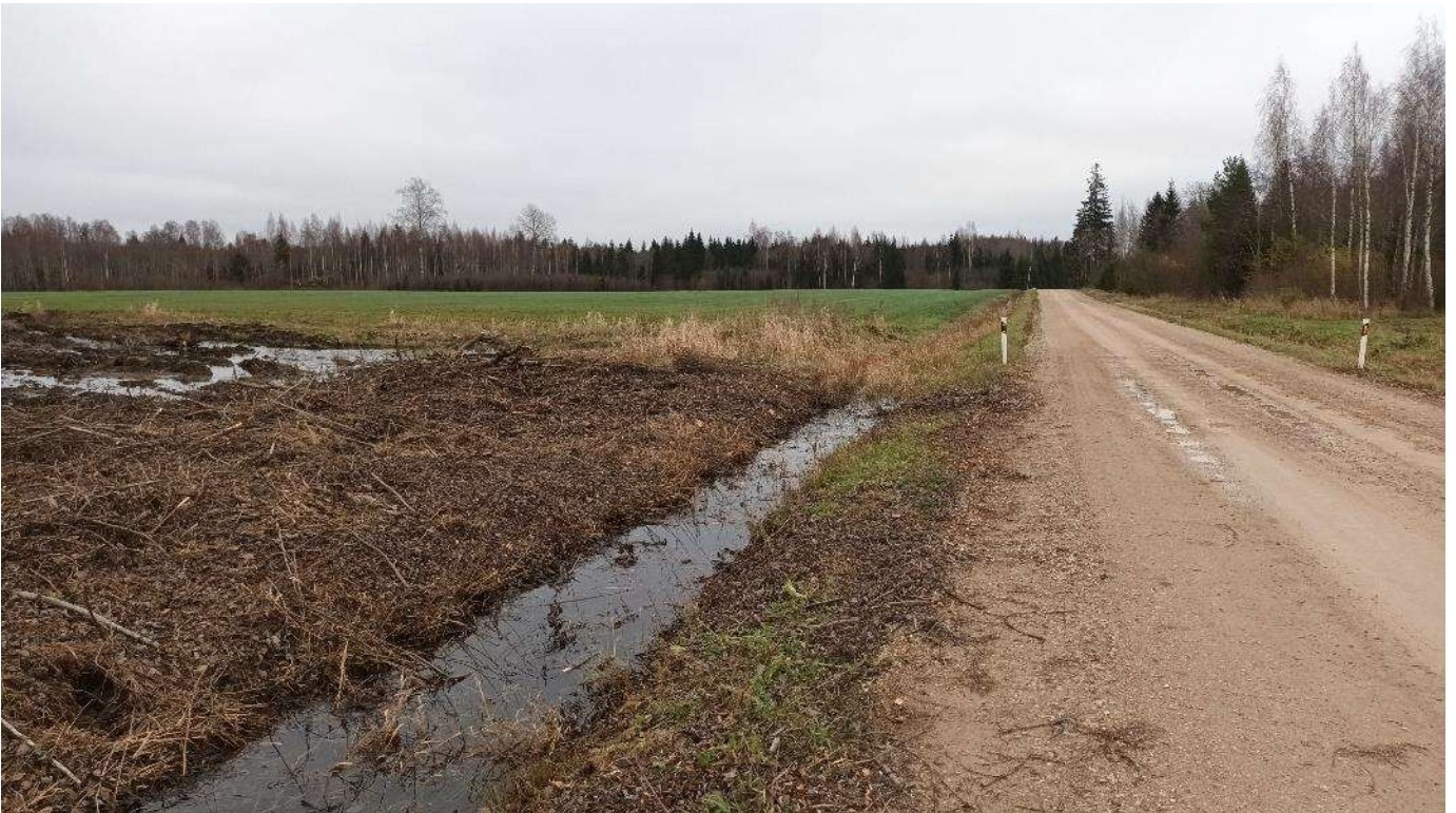
Foto 5. Teekraav T-5, 06.11.2024. Helkurpostide juures teetruup. Truubis ja teekraavides seisev vesi.