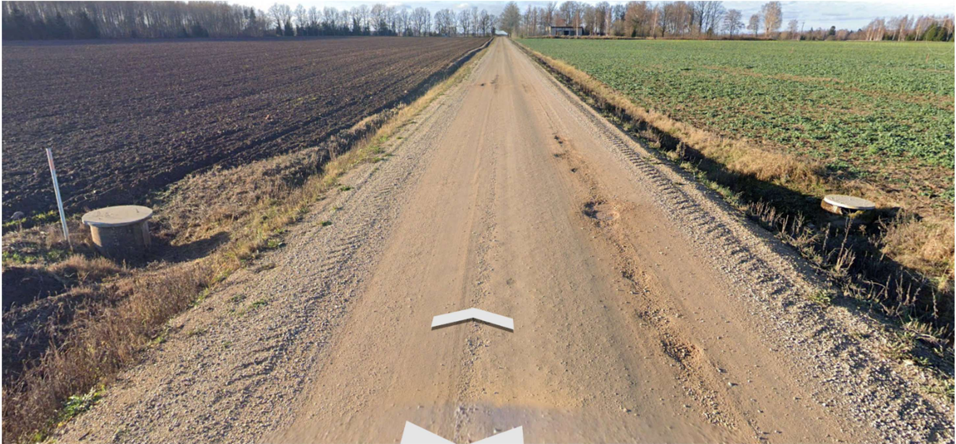
Foto 1. 24170 Rimmu-Kaarli tee 2,472 km'il olevad kraavikaevud, millede vahel on kõigi eelduste kohaselt düüker.