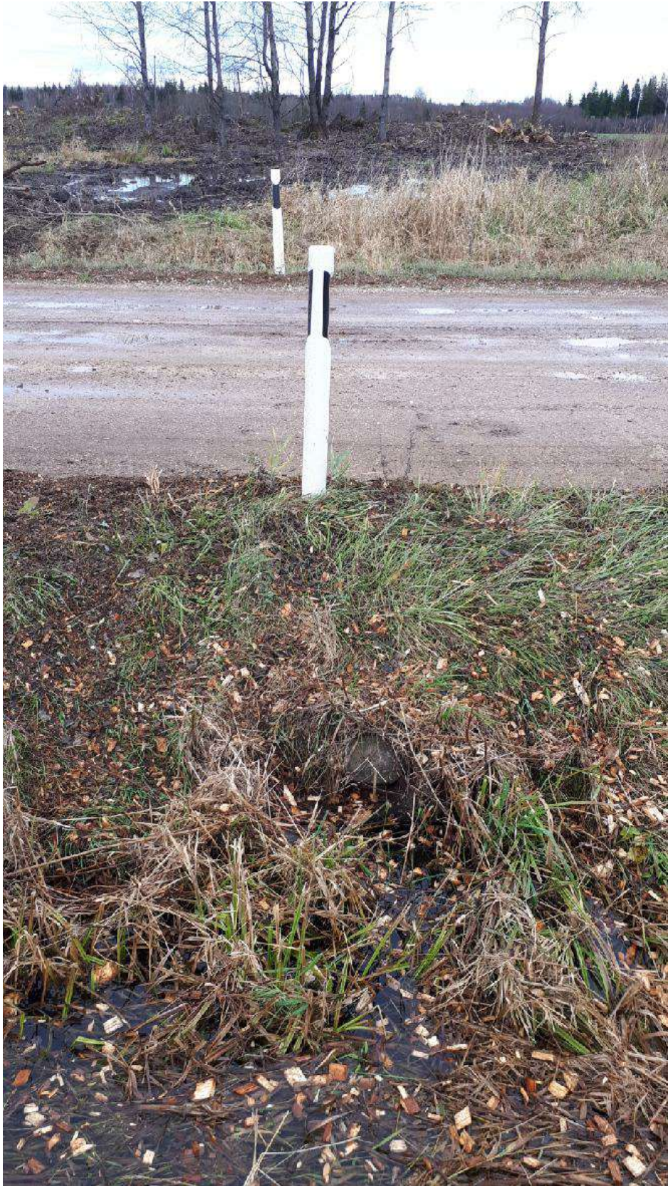
Foto 3. Välitööde aegne vaade truubi sissevoolule, 31.10.2024.