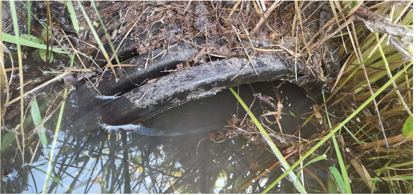
Foto 4. Vaade truubi sissevoolule, 12.09.2024. Truubis ja teekraavides seisev vesi.