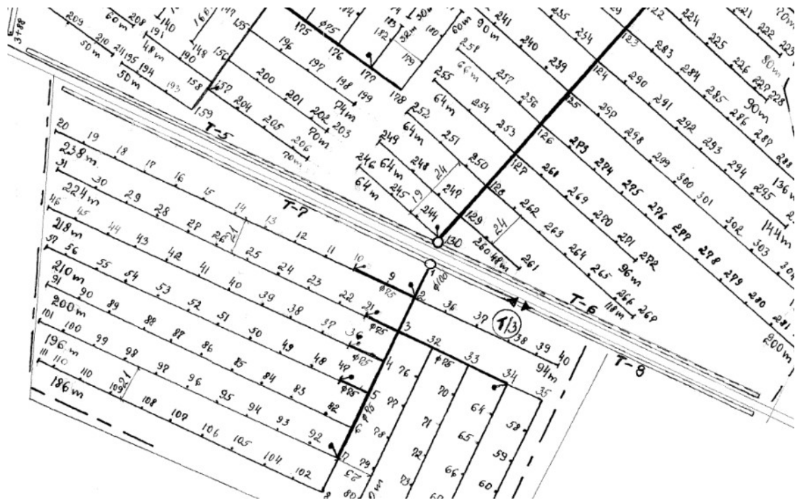
Skeem 3. Väljavõte 1965. a. „Viljandi raj. p.a. Rimmu maaparandusobjekti eksploatatsiooni andmise materjalid“ teostusjoonisest riigitee aluse truubi (km 3,041) asukohas (truup paikneb drenaažikaevude mõõtpikettidega 1 ja 130 vahel).